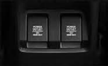
2 nd Row Power Outlet