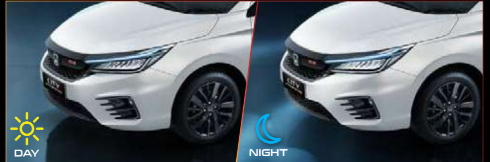
New Auto Headlights