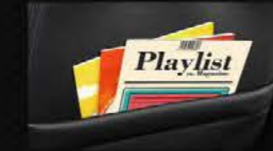
Seat Back Pocket