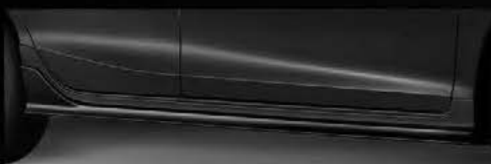
Side Under Spoiler