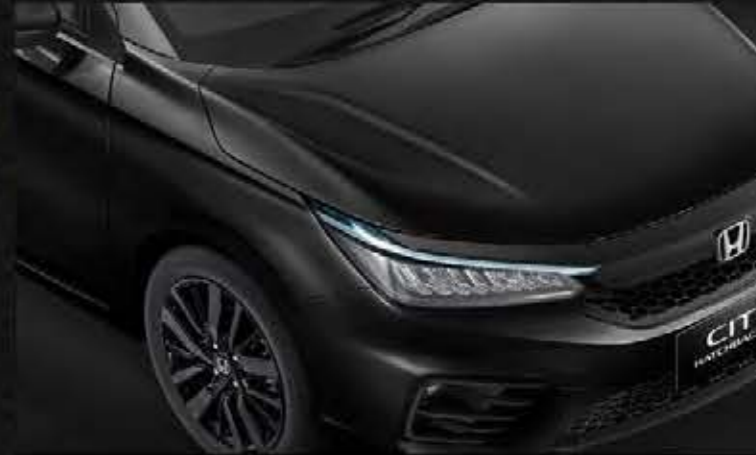
Crystal Black Pearl