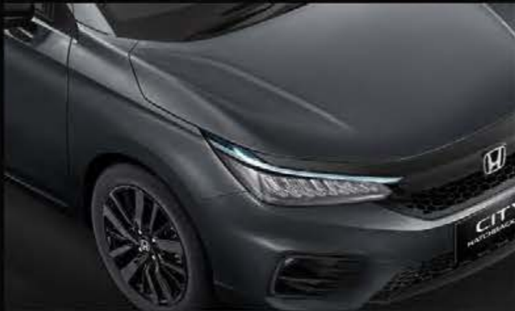
Meteoroid Gray Metallic