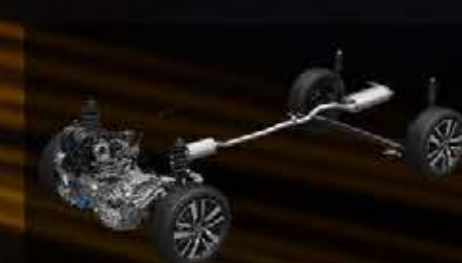
MacPherson Strut & H-Shape Torsion Beam Suspension