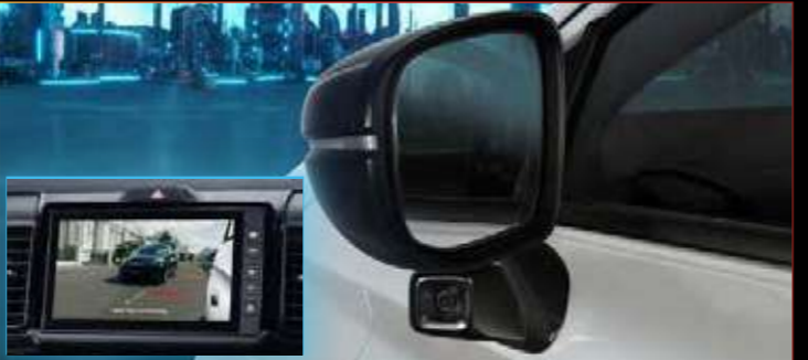
New Honda LaneWatch™