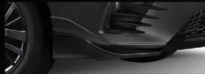
Front Under Spoiler