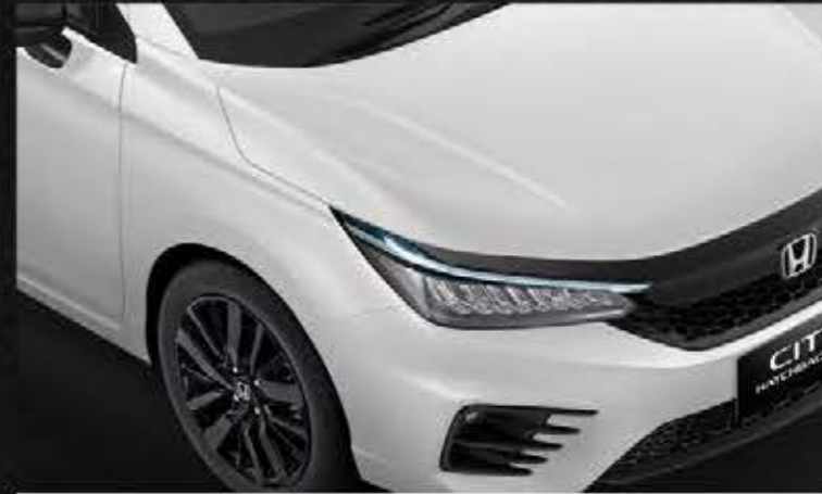
Platinum White Pearl