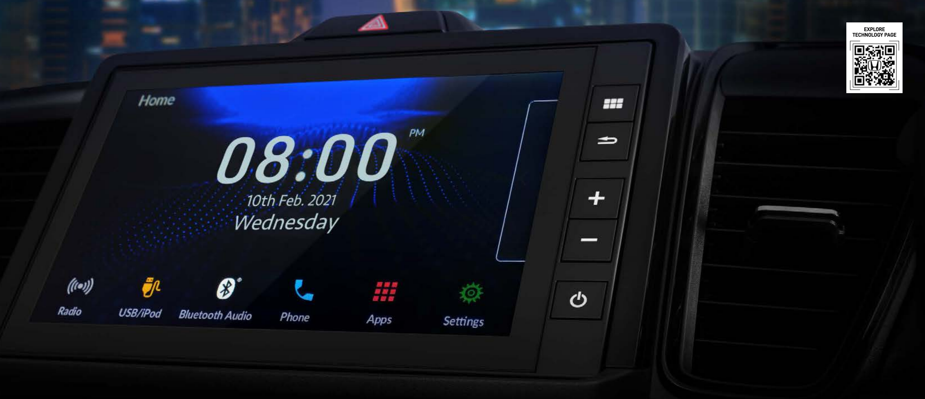
8" Advanced Capacitive Touchscreen Display Audio