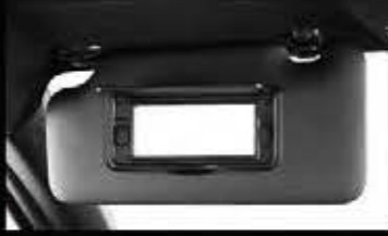
Sun Visor with Vanity Mirror