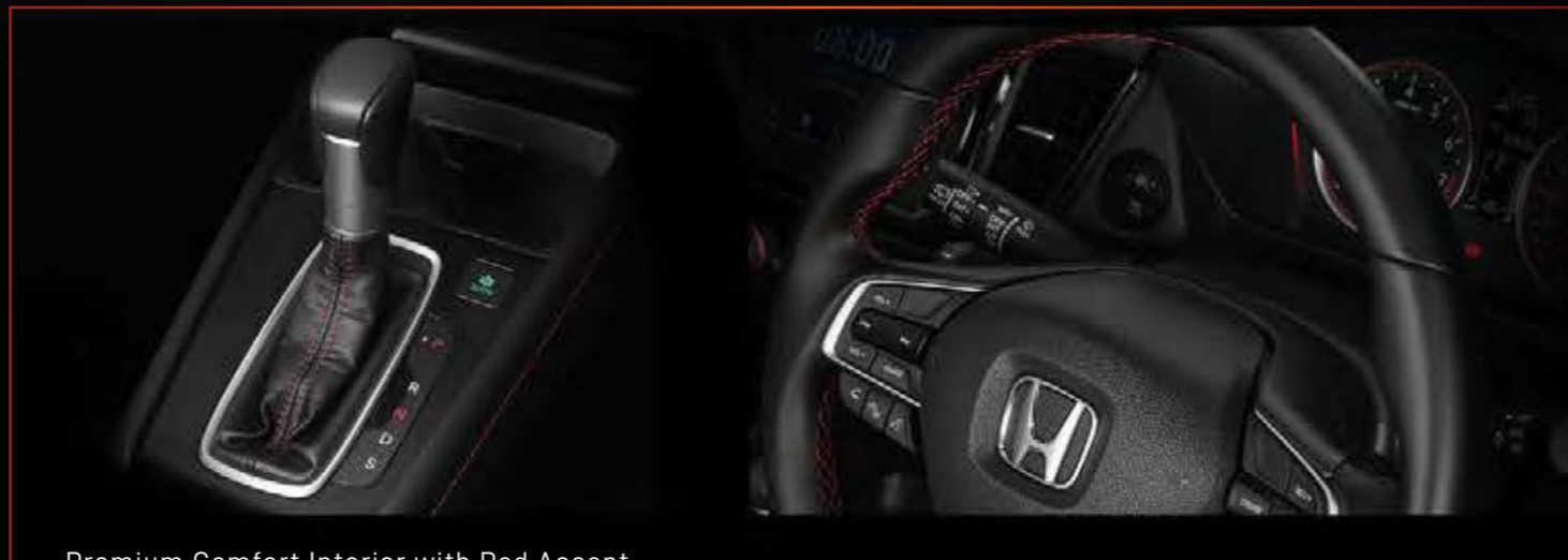
Premium Comfort Interior with Red Accent

Kabin yang luas berlapis material berkualitas untuk menghadirkan kenyamanan yang berkelas, semakin memantapkan Anda untuk terus melangkah ke depan.