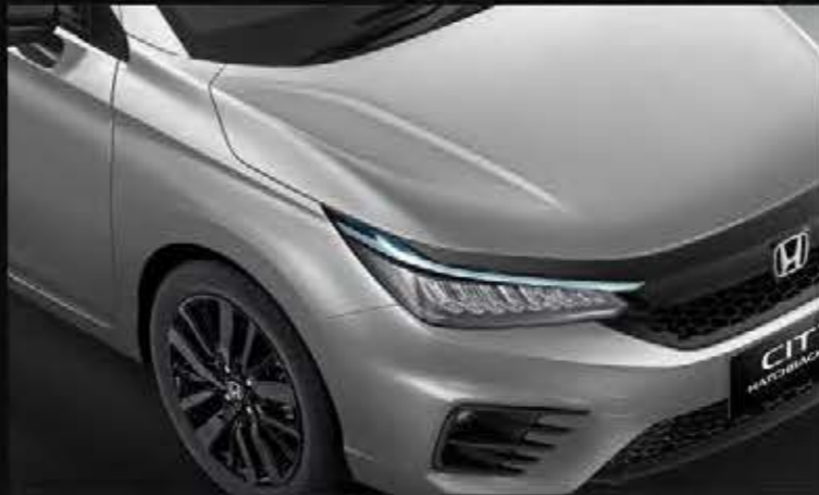
Lunar Silver Metallic