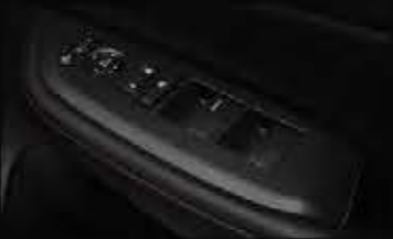
Door Switch Panel