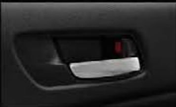
Auto Door Lock by Speed