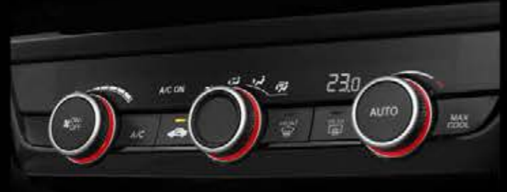
Auto A/C with Red Illumination

Nikmati pengalaman berkendara yang sporty dan premium di dalam kabin yang didesain untuk mendukung hasrat Anda dalam berinovasi.