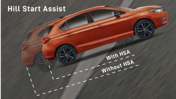
Hill Start Assist