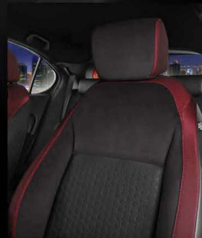
Suede-Fabric-Leather Combi Trimmed Seats