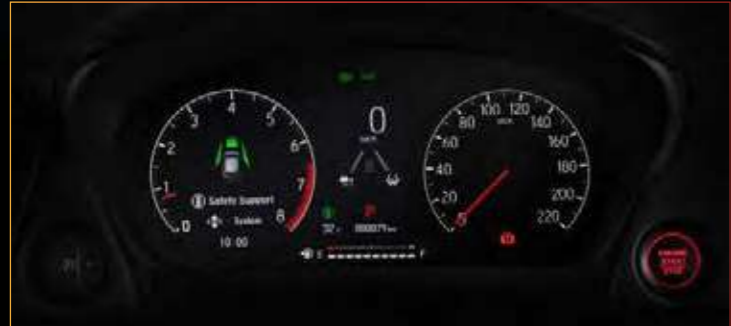
New 7" Interactive TFT Meter Cluster

Saat Anda berkendara diatas kecepatan 40km/jam dengan posisi tuas lampu diputar dari low beam ke posisi AUTO, sistem ini secara intuitif akan berganti antara lampu besar dan lampu normal tergantung pada situasi jalan.