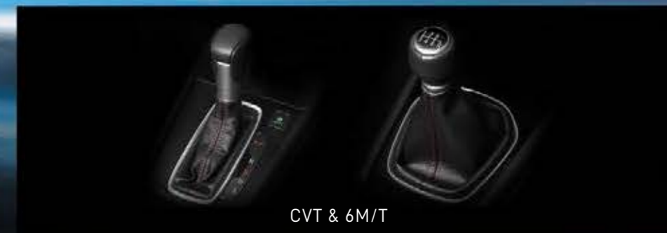
CVT & 6M/T