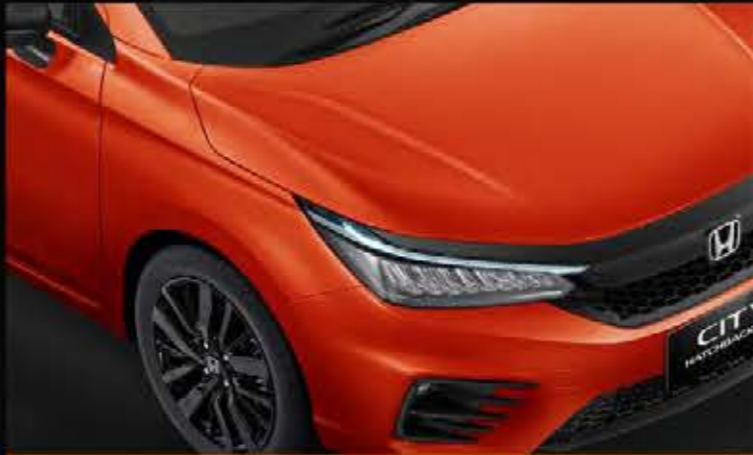
Phoenix Orange Pearl

Honda City Hatchback RS tampil dengan enam pilihan warna berbeda yang mencerminkan karakter Anda yang dinamis.