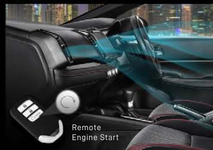
Remote Engine Start