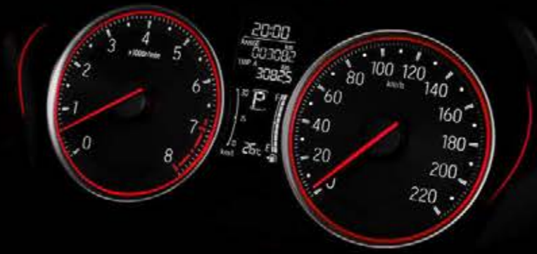
Sporty Meter Cluster with Red Accent

One Push Ignition System | Cruise Control | Audio Steering Switch | HFT Switch with Voice Recognition | Leather Door Lining with Red Stitches