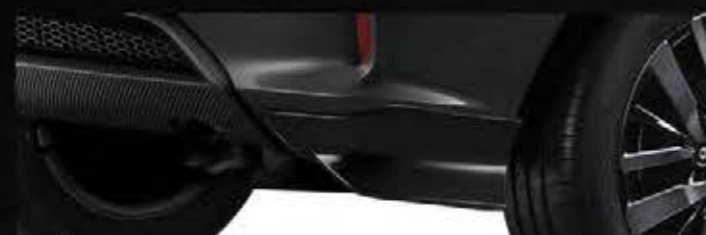
Rear Under Spoiler