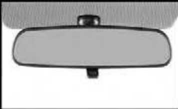
Day/Night Rear View Mirror