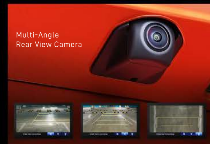
Multi-Angle Rear View Camera