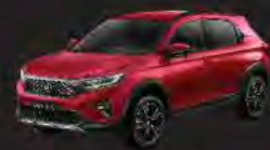
Ignite Red Metallic (RS type)