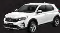
Taffeta White (E type)