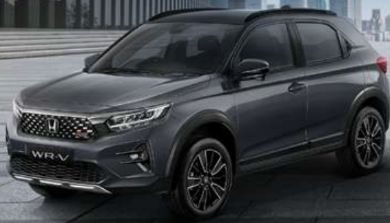
RS Type with Honda SENSING