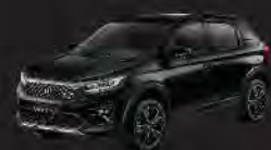
Crystal Black Pearl