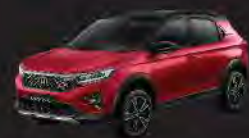
Ignite Red Metallic Two Tone (RS type)

Spesifikasi, fitur dan material dapat berbeda dengan aktual kendaraan yang dijual. Perubahan warna, material serta kelengkapan dapat berubah sewaktu-waktu tanpa pemberitahuan terlebih dahulu.