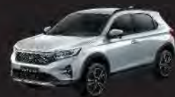
Stellar Diamond Pearl (RS type)