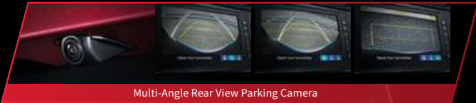
Multi-Angle Rear View Parking Camera