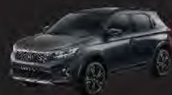
Meteoroid Gray Metallic